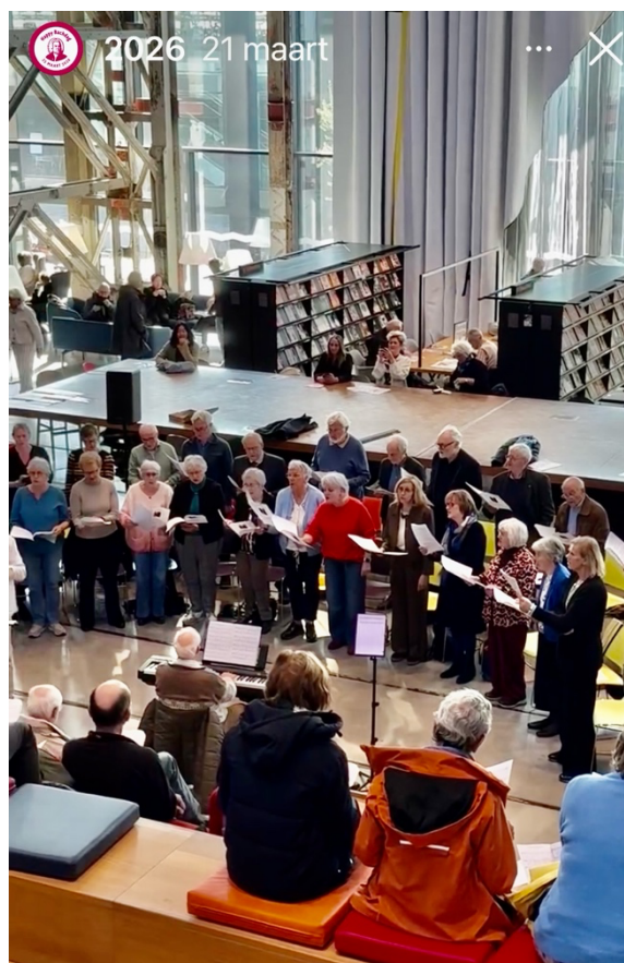
Optreden in de Lochal

De muziek van Bach is muziek vol herkenning en troost. Amateurs en professionals, jong en oud, voor en door Tilburgers.