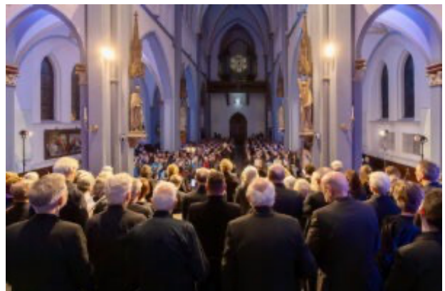
Opera aan het Park